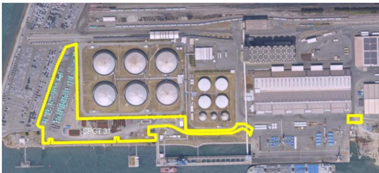
Slika 1: Lokacijski prikaz površin na pomolu II, ki se jih bo preuredilo za skladiščenje projektnih tovorov

1. del naročila (vezano na naložbo Ureditev površine za skladiščenje projektnih tovorov za potrebe PC GT) (v nadaljevanju: 1. del naročila): Izdelava IDP, DGD in PZI dokumentacije, izvajanje projektantskega nadzora za ureditev površine za skladiščenje projektnih tovorov za potrebe PC GT