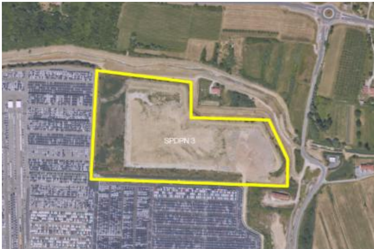
Slika 4: Lokacijski prikaz območja kasete 7A

Podrobno so vse naložbe in obseg naročila opisani v priloženih projektnih nalogah, ki so dosegljive na povezavi: 03 Dokumentacija za razpis