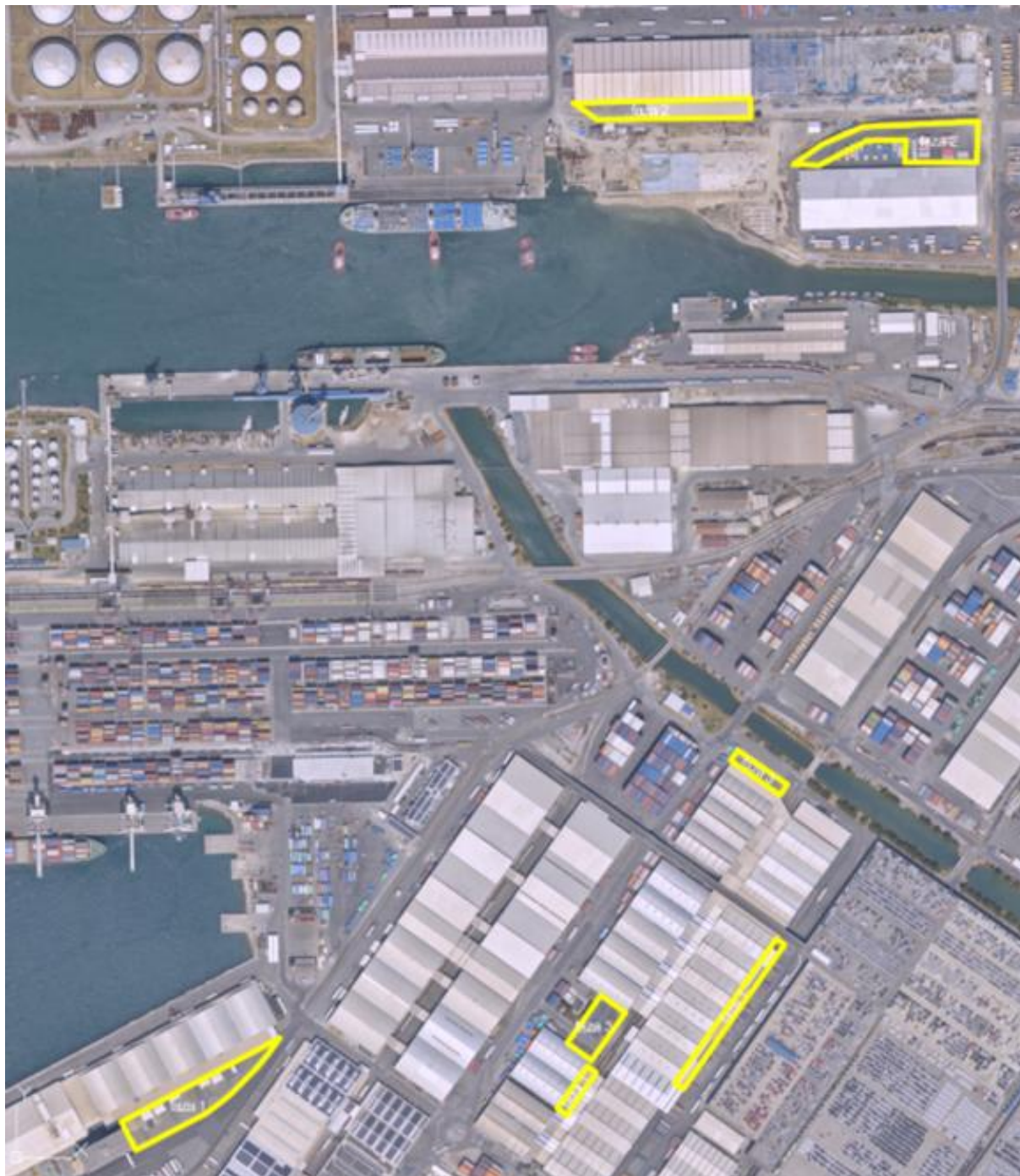
Slika 2: Lokacijski prikaz površin, ki je potrebno utrditi za potrebe PC GT

2. del naročila (vezano na naložbo Utrjevanje manipulativnih površin na območju PC GT) (v nadaljevanju: 2. del naročila): Izdelava Elaborata dimenzioniranja voziščnih konstrukcij, PZI ter izvajanje projektantskega nadzora za utrjevanje manipulativnih površin na območju PC GT