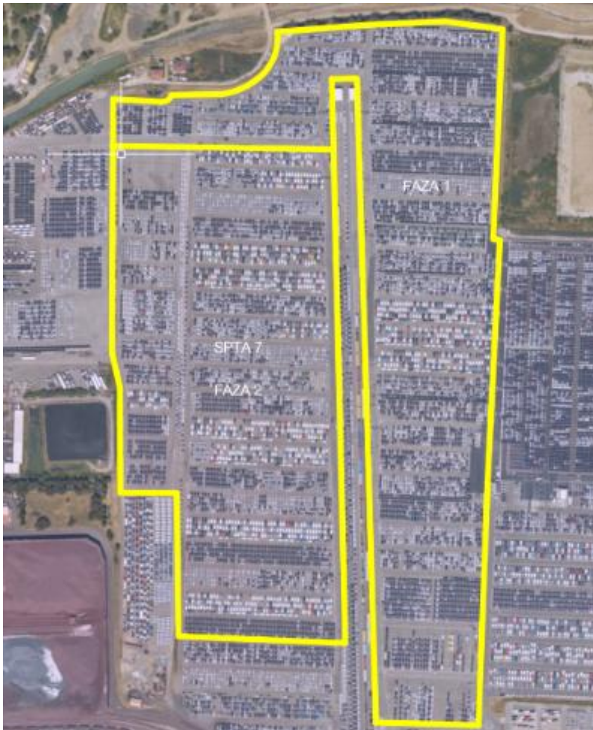
Slika 3: Lokacijski prikaz predvidenih površine TR 11-TR17

3. del naročila (vezano na naložbo Ureditev odvodnjavanja in razsvetljave skladiščne površine TR 11-TR17) (v nadaljevanju: 3. del naročila): Izdelava DGD,PZI dokumentacije, ter izvajanje projektantskega nadzora za ureditev odvodnjavanja in razsvetljave skladiščne površine TR 11-TR17